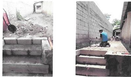
foto 2 reconstruccion de torta de concreto