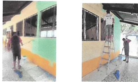
foto 4 pintura en muros