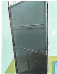
foto 3 cambio de chapas