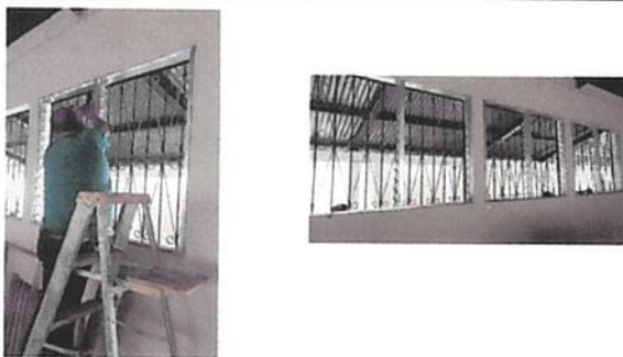
foto 5 cambio de ventanas

Observación: Si es necesario se pueden agregar hojas adicionales y actualizar el número de hojas.