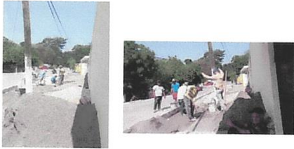
foto 1 torta de concreto